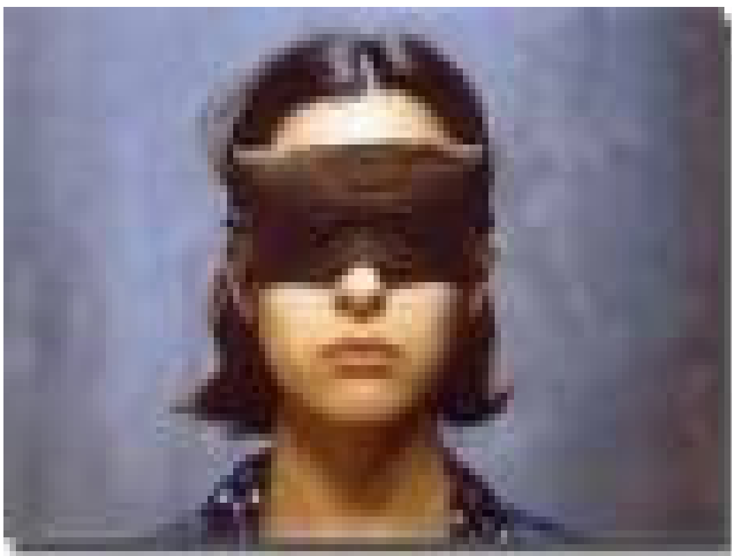
Foto 02 – Registro fotográfico da Ditadura Militar

Neste capítulo, discuto a intrínseca relação existente entre avaliação e educação na educação superior, para apresentar a concepção de avaliação que orienta minhas análises ao longo de todo o estudo. Meu foco é a avaliação como fenômeno social que expressa uma prática social presente não apenas nos sistemas educacionais formais, mas em toda sociedade. É um fenômeno ético-político que opera com valores referenciados em diferentes e distintos grupos sociais e serve a uma concepção de educação articulada a uma