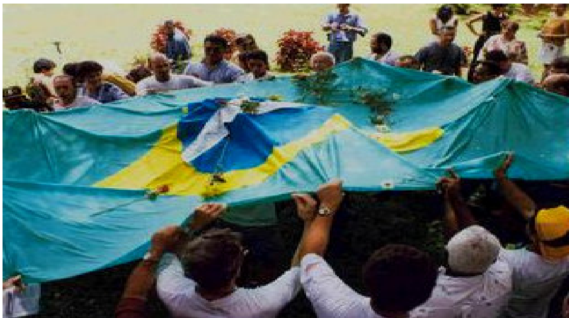
Foto 03 – Registro da Abertura Política no Brasil

Neste capítulo, amplio minhas reflexões acerca da consolidação da avaliação no Brasil, pertinente ao processo de sua institucionalização como uma Política Pública Educacional, que no âmbito da educação superior fez com que o ENC se convertesse na sua expressão máxima, uma tecnologia adotada para materializá-la nesse nível de ensino, processo questionável e paradoxal, uma vez que o Exame Nacional de Cursos, tornou-se a principal referência da ação avaliativa conduzida pelo Estado, a base corpórea da política, o que fez com que o mesmo passasse a ser confundido ou entendido como sinônimo da própria política.