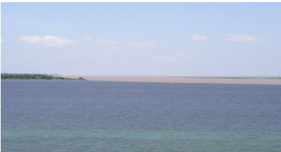
Foto 09 – Visão Panorâmica do Encontro das Águas (Vista aérea)

Encerro o capítulo com uma mensagem que acredito expressar bem o cotidiano de um Curso que no interior da Amazônia Brasileira tem tentado sobreviver, apesar das inúmeras limitações e determinações impostas ao ensino superior brasileiro. Em Santarém, assim como as águas dos dois grandes rios Amazonas e Tapajós se chocam, se abraçam e se interpenetram, num encontro que é único, belo e ímpar na particularidade de sua rara beleza, no Curso de Pedagogia da UFFPA, se tem procurado construir uma feição própria, a partir do respeito a idiossincrasias e com a intenção de dar sentido e beleza à formação e à vida profissional e pessoal, de alunos e professores, sob orientação da filosofia e dos princípios da base curricular do Curso, com vista a uma maior responsabilidade social.