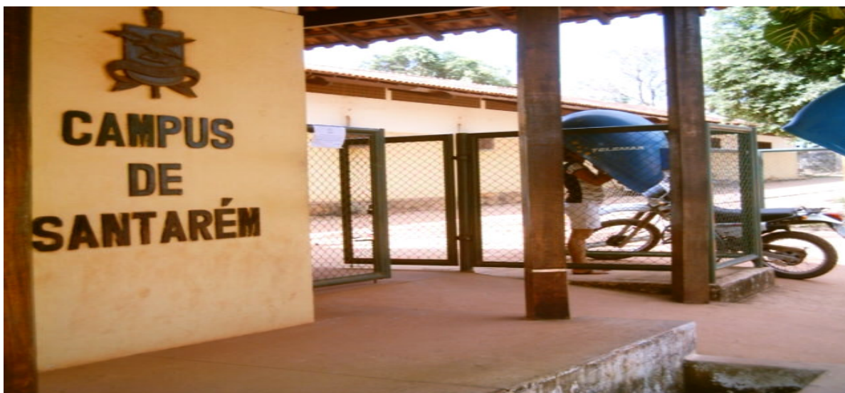
Foto 07 – Vista do Campus Universitário da UFPA de Santarém

O Curso foi ofertado pela primeira vez em caráter regular, no município, em 1983, com Licenciatura Plena em Administração Escolar. A idéia inicial era tornar a oferta de vagas regular e permanente, o que naquele momento não aconteceu.