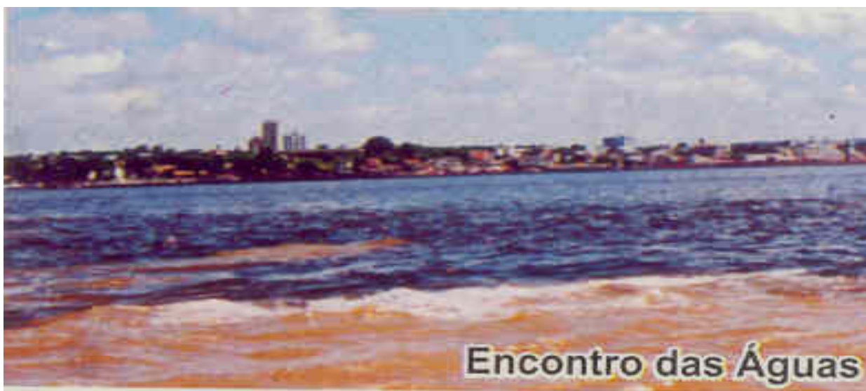
Foto 05 – O Turbilhão das Águas dos rios Tapajós e Amazonas (vista do rio) – Recorte

Dependendo do horário que se observa, é possível perceber com que fúria os rios se chocam para, em seguida, se tornarem serenos (Foto 08). Além de nos ensinar que é possível viver e conviver na diferença, também ensinam que é possível viver na diferença e, ao mesmo tempo, buscar e manter o equilíbrio e a serenidade em função de uma razão maior, no caso dos rios a vida e a natureza, no caso do curso a formação.