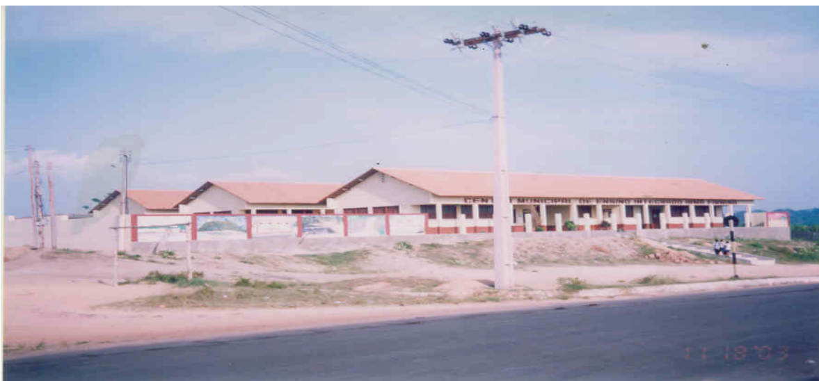
Foto 08 - Escola Municipal Irmã Firmina – Núcleo de Óbidos – Carlos Vieira

No entanto, ainda que não fosse em caráter permanente, em Santarém, o Curso já ofertava sua quinta turma regular, o que contribuiu para que, nesse mesmo ano, através de uma parceria estabelecida entre a UFPA/PROAD e a Prefeitura Municipal de Óbidos, fosse efetivada a primeira turma do Curso de Licenciatura Plena em Pedagogia fora de sede, do Campus de Santarém, como extensão das atividades acadêmicas ali realizadas. Instalava-se assim o Núcleo de Óbidos (Foto 08), onde, a partir do ano de 1994, passou a funcionar uma turma constituída por 50 alunos regularmente matriculados, concluintes de 1999. Com o término da primeira turma, uma nova foi ofertada no mesmo formato. A turma de 1999 integralizou seus estudos no primeiro semestre de 2004 e participou do ENC, em 2003.