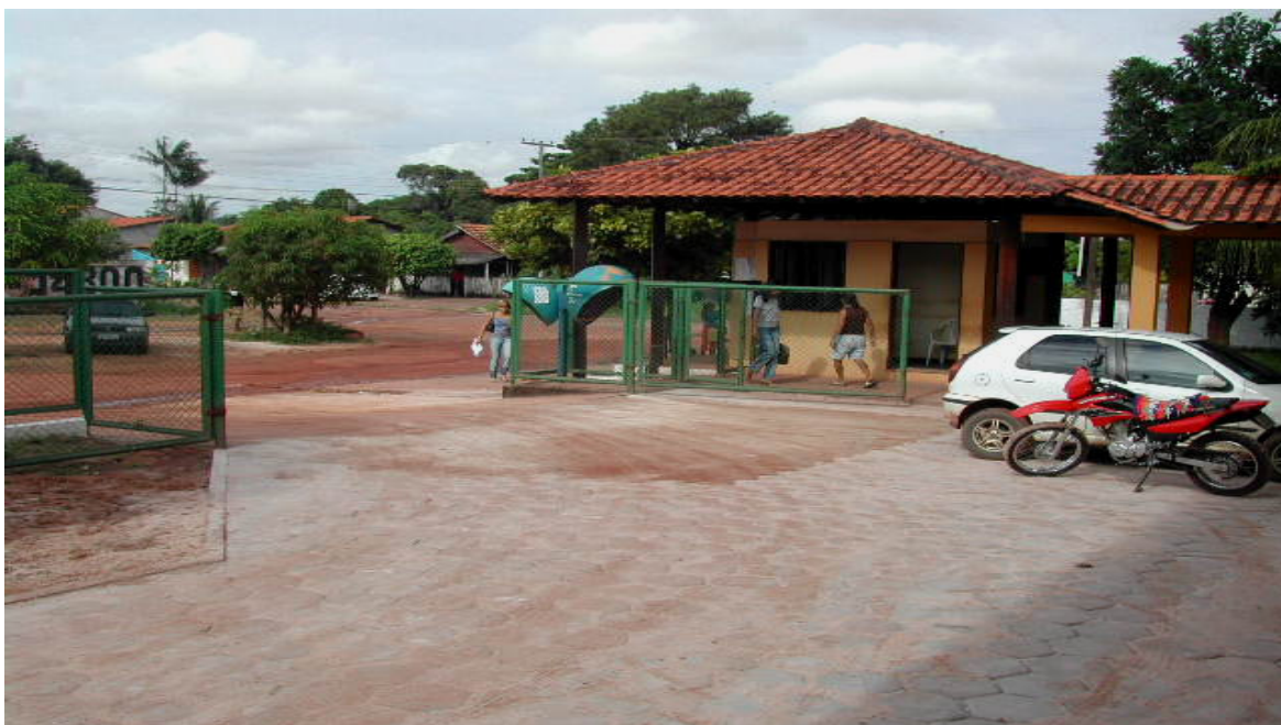
Foto 10 - Vista da entrada lateral do Campus da UFPA/Stm

Considerando a importância deste estudo para a Ciência da Educação e sem a pretensão daqueles que almejam transformar a ciência em um conhecimento conclusivo e acabado, encerro este trabalho apresentando algumas considerações finais a respeito do tema estudado, por seus aspectos sócio-históricos e os resultados da análise dos relatos orais dos sujeitos da pesquisa, na perspectiva de alcance do objetivo proposto.