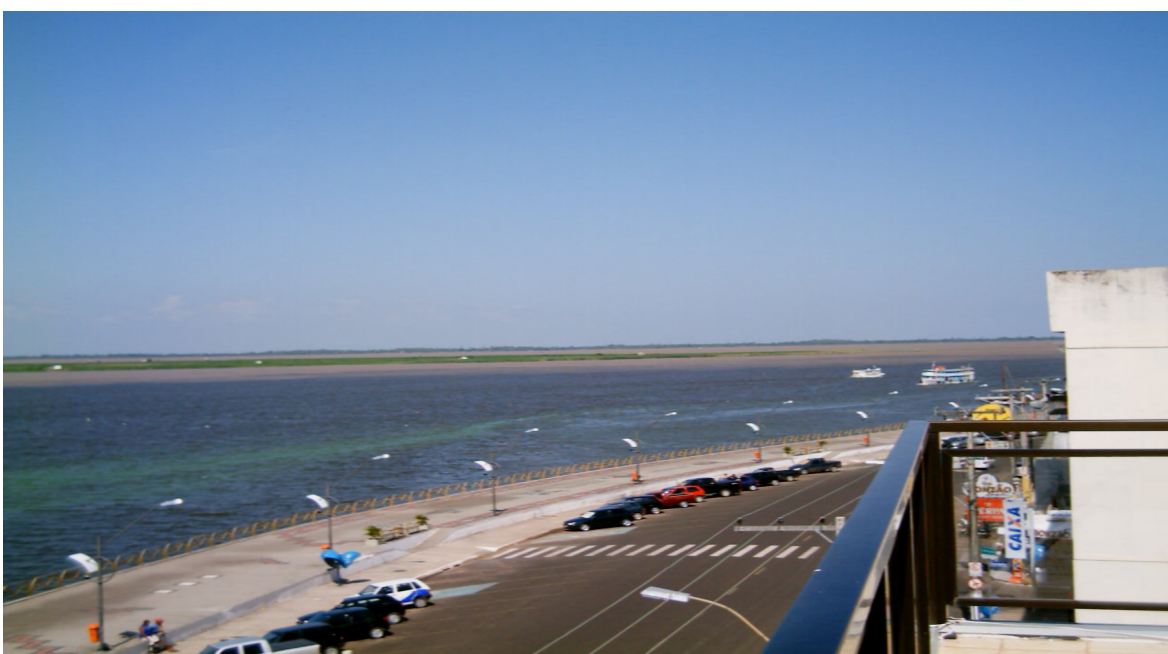
Foto 04 – O Encontro das Águas visto da Orla de Santarém (vista aérea) - Paulo Carvalho

Nesse capítulo, o objetivo é descrever e interpretar os resultados da análise dos relatos orais de egressos e professores do Curso de Pedagogia do Campus da UFPA, em Santarém. Os resultados se apresentaram contraditórios e apaixonantes. Este fato e a última conversa com o orientador me instigaram a estabelecer uma analogia entre estes e um fenômeno natural característico na minha terra – O Encontro das Águas - que eu vejo todos os dias em minha cidade. Fenômeno que parece estar ao “alcance das mãos” quando visto da orla da cidade (foto 04), compondo o cenário cotidiano da vida, tanto do santareno nativo como do visitante, pois ambos têm no rio sua rua, seu principal ponto de passagem, de idas, vindas e chegadas.